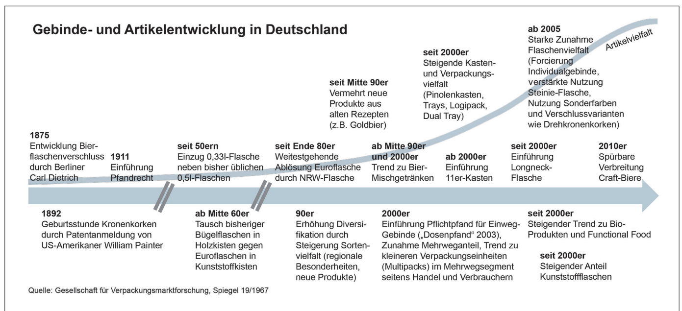
Abb. 1: Einflussfaktoren steigender Sortimentskomplexität im Zeitverlauf

All dies führt zu einer der wichtigsten Herausforderungen der modernen Getränkeindustrie: steigende Komplexi-